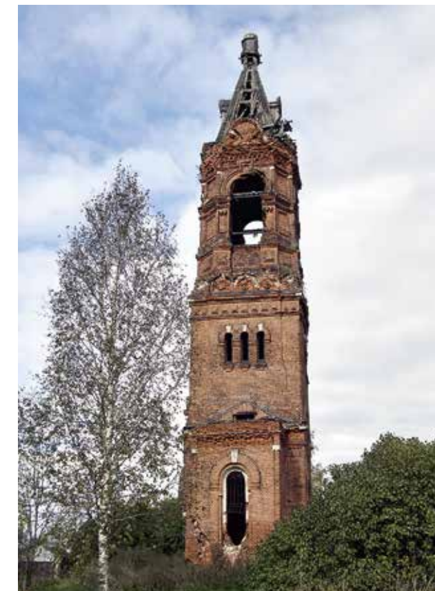
Иоанно-Предтеченский храм дер. Языково Дмитровского р-на