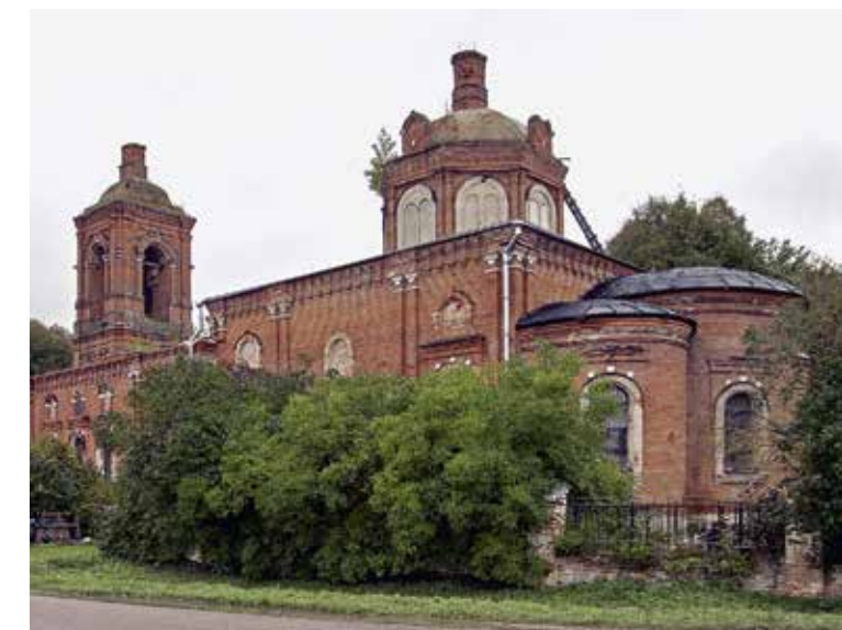
Храм Казанской иконы Божией матери с. Трехсвятское Дмитровского р-на