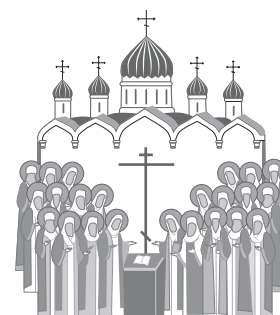
ПОЧИТАНИЕ НОВОМУЧЕНИКОВ И ИСПОВЕДНИКОВ