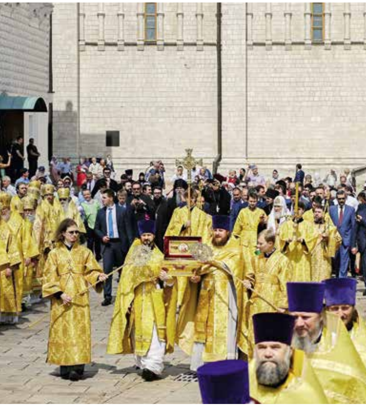
За Литургией исполнялись праздничные антифоны Дня Крещения Руси, написанные в

1988 г. к 1000-летию этого исторического события.