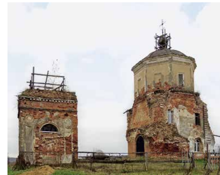
Воскресенский храм дер. Юрлово Можайского р-на