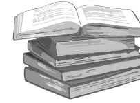
БОГОСЛОВИЕ И АПОЛОГЕТИКА

Материал подготовлен Щелковским благочинием