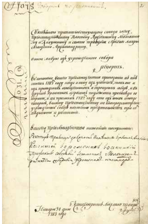
РГАДА. Ф. 1204. Оп. 1. №1080 (1783 г.). Л. 2. Рапорт о присылке расписания проповедей с резолюцией архиепископа Платона (Левшина)

родицы, Архангела Михаила, апостолов Петра и Павла, святителей Иоанна Златоуста и Николая Чудотворца и, конечно, на дни памяти преподобного Сергия. Проповеди говорились в недели Великого поста и подготовительные к ним, а также в недели Пасхального периода. Помимо основных праздников, предписывалось иногда говорить специально составленные проповеди с Фоминой недели в воскресные дни 4 .